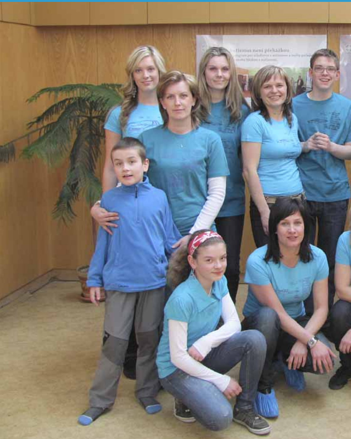
2. 4. 2010 „Light It Up Blue“ Mezinárodní den autismu v modrém