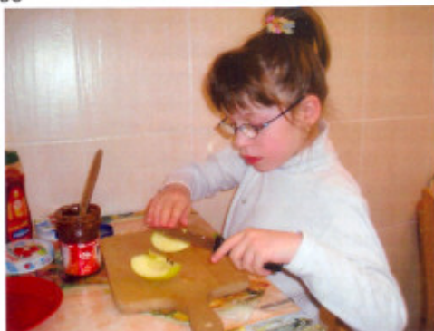
schéma je rozfázováno do jednotlivých činností pomocí piktoqramů tak, aby dítě s autismem za pomoci asistenta dokázalo dle vizualizace připravit šťávu či čaj, namazat chleba, apod. Souběžně s kroužkem probíhala pod vedením asistenta hra s rytmickými hudebními nástroji s prvky muzikoterapie, tzv. autirytmu (cabasa, rumba, deštné hole, jembé apod.) Díky jednoduchým přírodním nástrojům je u dětí procvičováno vnímání, jemná motorika a alternativní komunikace.