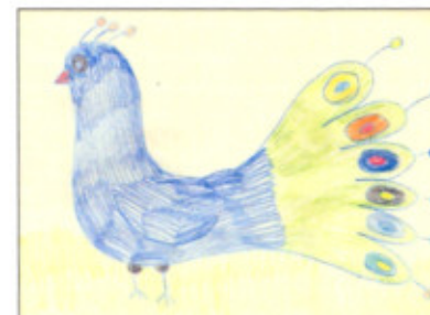
Lucie 14 let

Autismus je pojem, který jen velice málo lidí dokáže přesně specifikovat. Pro širokou veřejnost jsou to jednoduše lidé, kteří mají svůj vlastní uzavřený svět. Diagnóza autismus je velice špatně uchopitelná. Popsat projevy, problematiku stanovení diagnózy, komunikaci s touto osobou, následnou péči, denní režim, strukturu, sociální chápání a vnitřní neopakovatelný svět autisty je poměrně složité. Možnou definici autismu uvádí portál www.autismus.cz „Autismus je jednou z nejzávažnějších poruch dětského mentálního vývoje. Jedná se o vrozenou poruchu některých mozkových funkcí. Porucha vzniká na neurobiologickém podkladě. Důsledkem poruchy je, že dítě dobře nerozumí tomu, co vidí, slyší a prožívá. Duševní vývoj dítěte je díky tomuto handicapu narušen hlavně v oblasti komunikace, sociální interakce a představitosti. Autismus doprovází specifické vzorce chování.“ V souvislosti se slovem autismus se neodmyslitelně setkáváme s pojmem pervazivní vývojová porucha zkráceně PAS. Tento pojem stručně popisuje Thorová: „Pervazivní vývojové poruchy patří k nejzávažnějším poruchám dětského mentálního vývoje. Slovo pervazivní znamená všepřonikající a vyjadřuje fakt, že vývoj dítěte je narušen do hloubky v mnoha směrech.“ 2