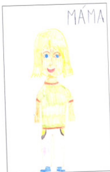
Lucie 14 let