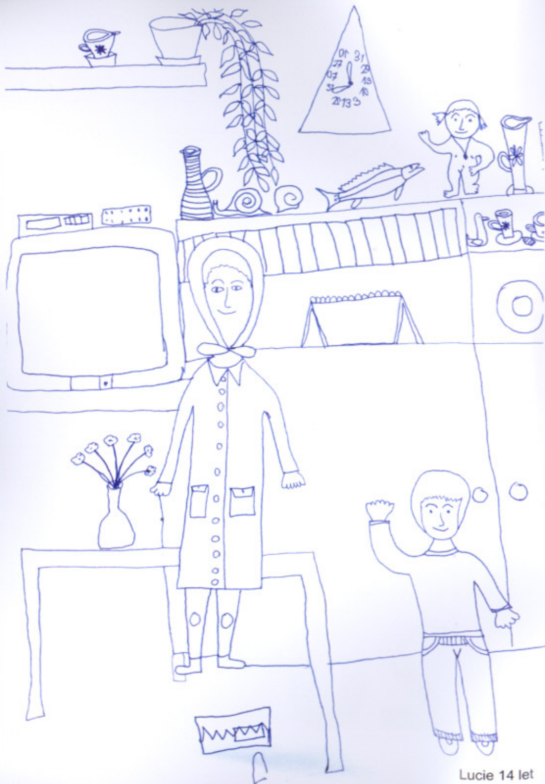
Lucie 14 let